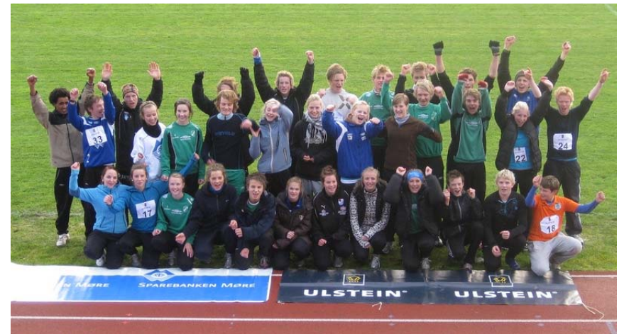
Deltakarane i 2009 kampen